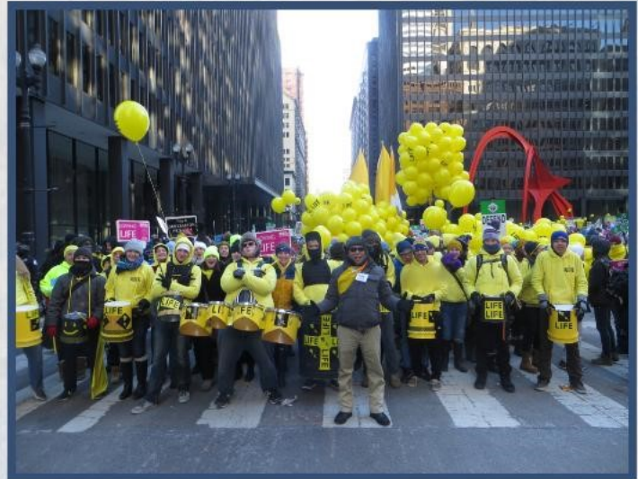
Mission Disciples/Pilgrims walking the Loop for Life

(sponsored by Deanery A, Vicariate IV Pro-Life Committee)