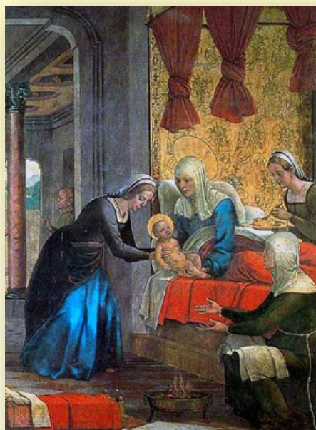
The Nativity of the Blessed Virgin Mary