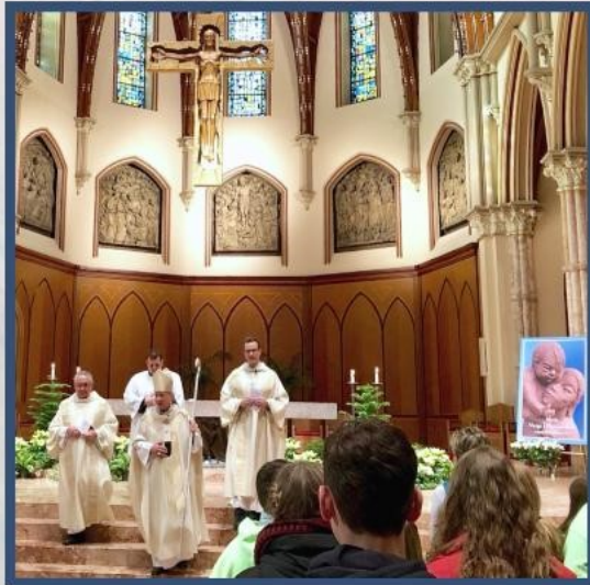
2018 Holy Name Cathedral Mass for Life ~ Cardinal Cupich with teens, Misericordia residents and parishioners praying before Chicago March for Life

Where: St. Constance Church 5856 W. Ainslie St. Chicago