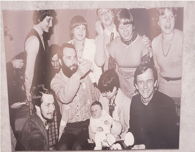
Chrzest dziecka studentów medycyny, Warszawa 1979 r.