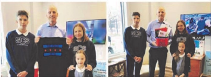
St. Constance School February 10 at 9:58 AM 🌐 Great job, St. Constance!!! 🙌