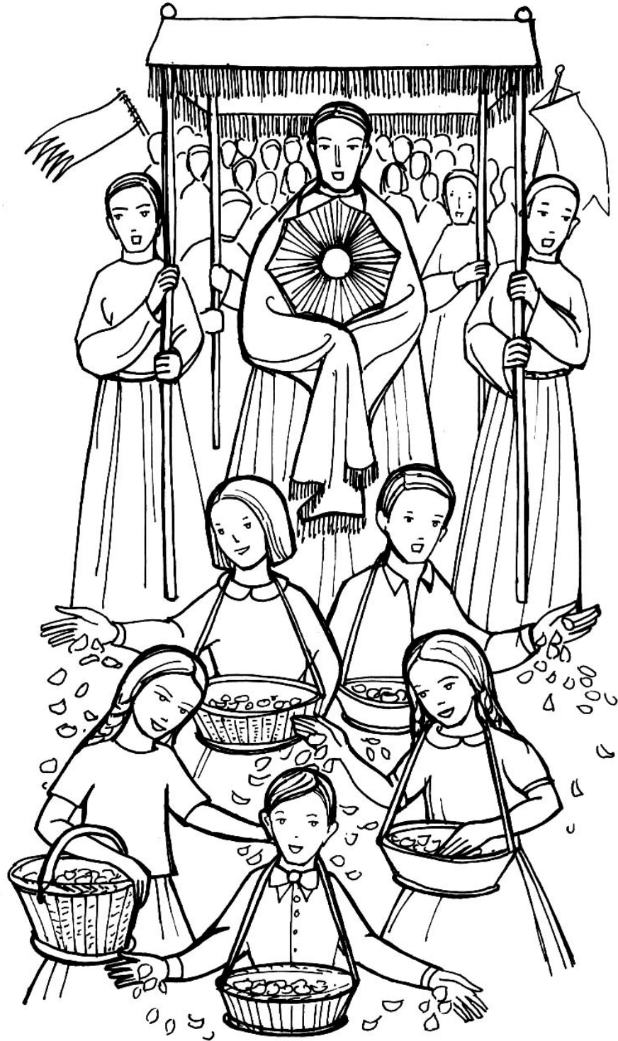
Uroczystość Bożego Ciała