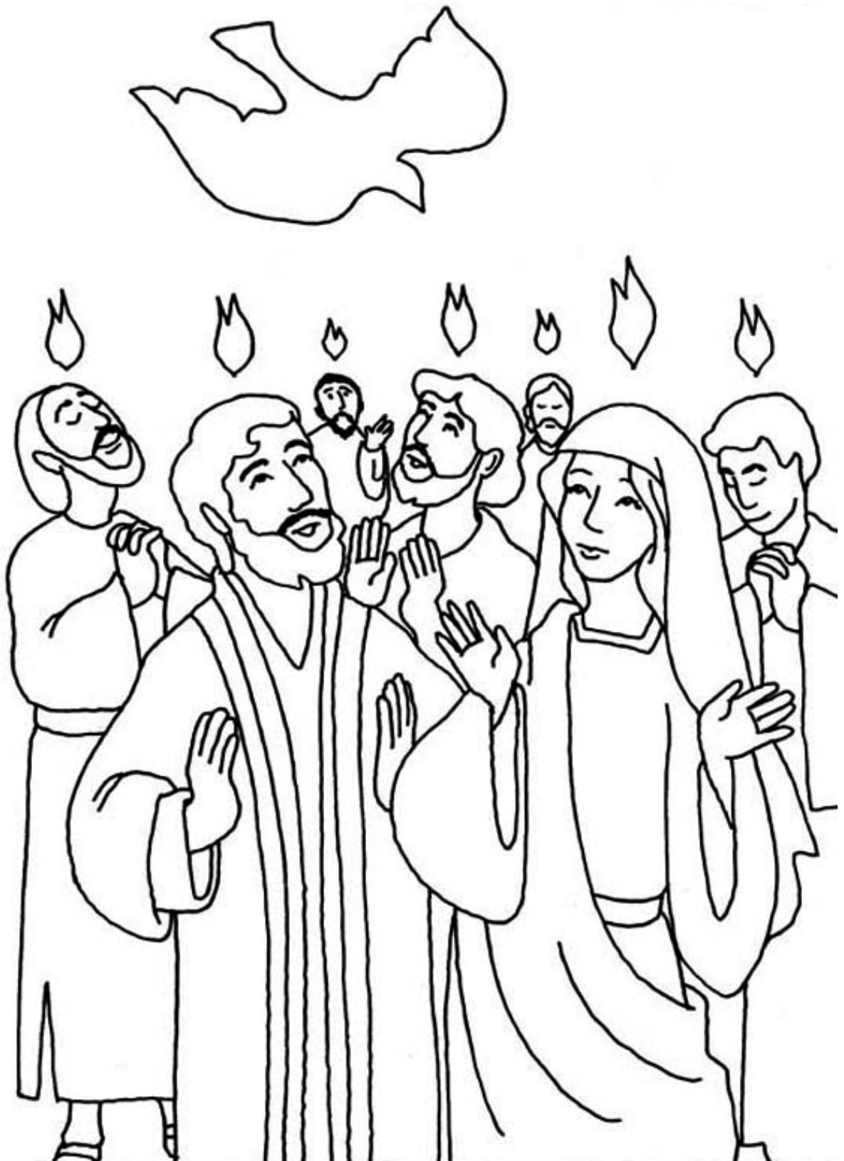
Zesłanie Ducha Świętego na Maryję i Apostołów